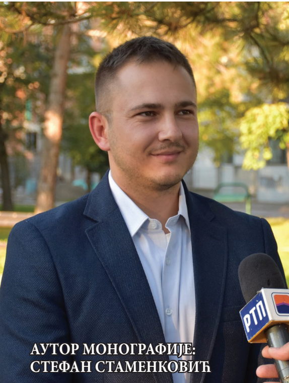
АУТОР МОНОГРАФИЈЕ: СТЕФАН СТАМЕНКОВИЋ