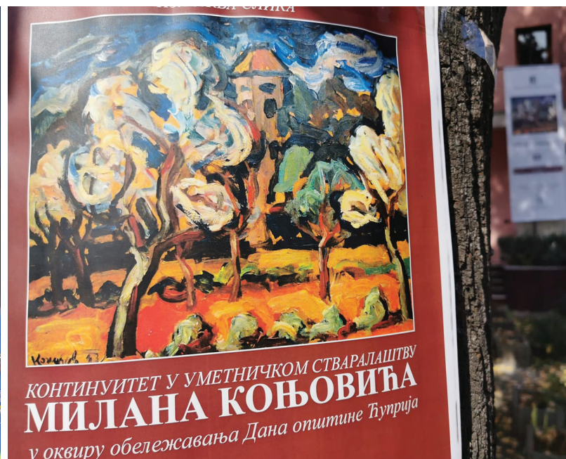
КОНТИНУИТЕТ У УМЕТНИЧКОМ СТВАРАЛАШТВУ МИЛАНА КОЋОВИЋА у оквиру обележавања Дана општине Ћуприја