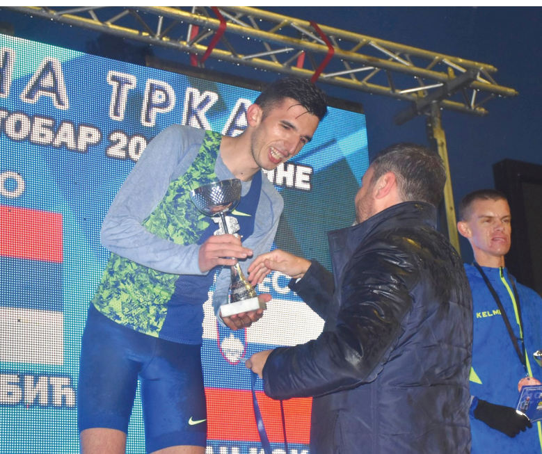
ОДРЖАНА 75. УЛИЧНА ТРКА "МЕМОРИЈАЛ АЛЕКСАНДАР АЦА ПЕТРОВИЋ".....стр. 05